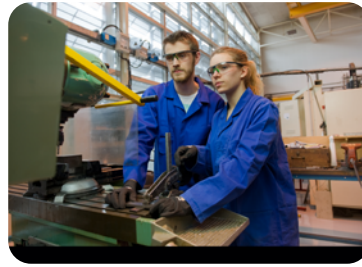
Ci-dessus, un exemple d'image à privilégier.

→ veiller à ce que les élèves intègrent ces recommandations dans les supports réalisés ;